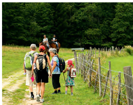
La randonnée débute tout en douceur. Ici, juste après le hameau La Bosse.