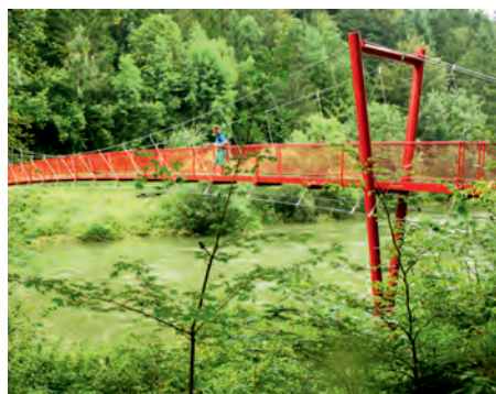
La passerelle rouge de Clairbief, non loin de la verrerie.