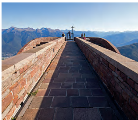
Wahrzeichen: Botta-Kapelle auf dem Monte Tamaro.