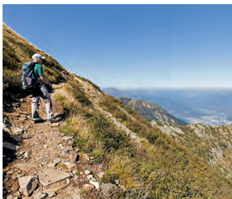
Aussicht von Beginn weg: Aufstieg zum Monte Tamaro.